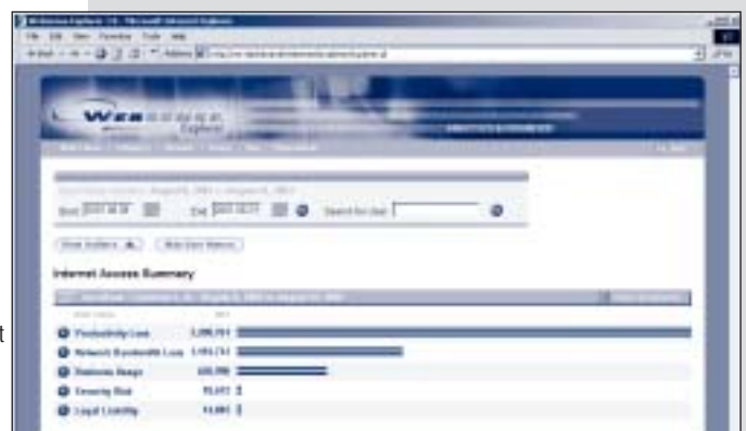
Vision instantanée des problèmes de trafic sur le réseau.