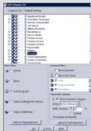
Websense v5 permet de restreindre l'accès à des sites spécifiques pour un utilisateur ou un service.

Websense Enterprise v5 vous offre des performances inégalées alliant une politique de filtrage flexible à une classification intelligente du contenu web, le tout sans problème supplémentaire pour les administrateurs réseau.